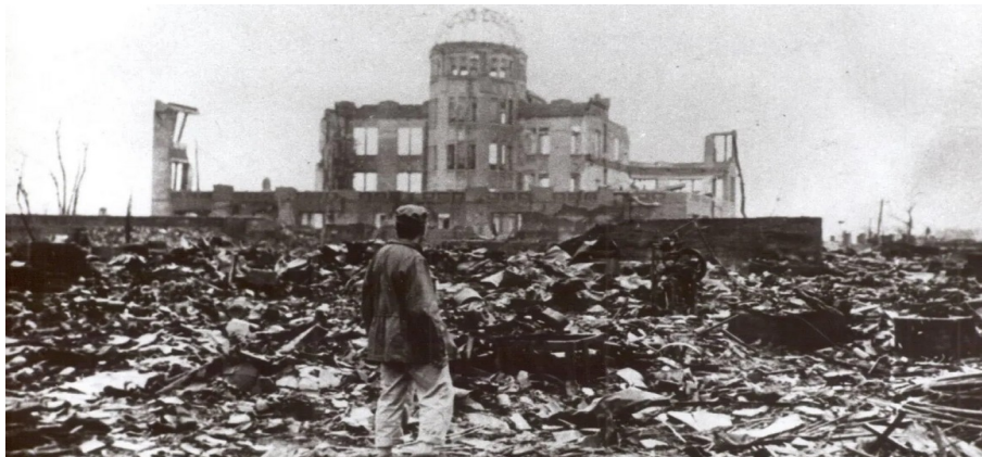
Hiroshima rasée par une bombe nucléaire, le 6 août 1945

Le vendredi 18 Octobre 2024 à 19h salle des fêtes de St-Matré 46800 Porte-du-Quercy Cette rencontre sera suivie d'un repas partagé.